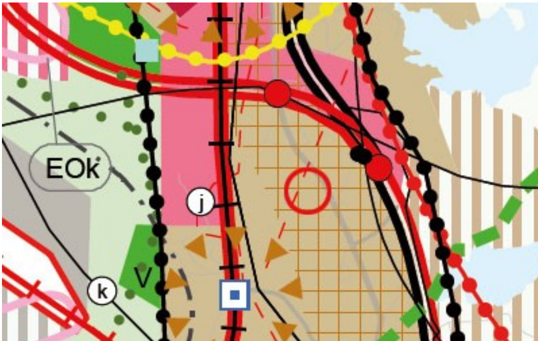
Ote maakuntakaavasta 2040. Suunnittelualueen sijainti on merkitty karttaan punaisella ympyrällä.

Maakuntakaavan mukaan suunnittelualue on taajamatoimintojen aluetta (ruskea väri) ja tiivistä joukkoliikennevyöhykettä (ruudutus). Alueen lähellä kulkee yhdysvesijohdon yhteystarve (punainen katkoviiva).