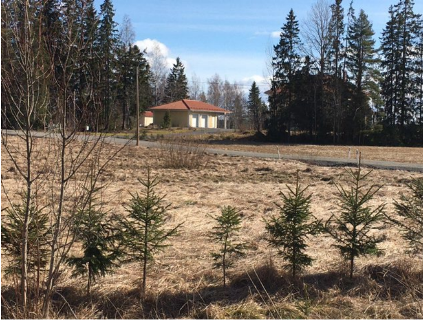
Asuinrakennus kaava-alueelta kuvattuna.