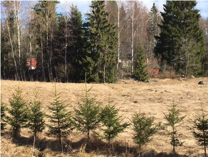
Asuinrakennus kaava-alueelta kuvattuna.

Alue on kokonaisuudessaan tarpeettoman laaja