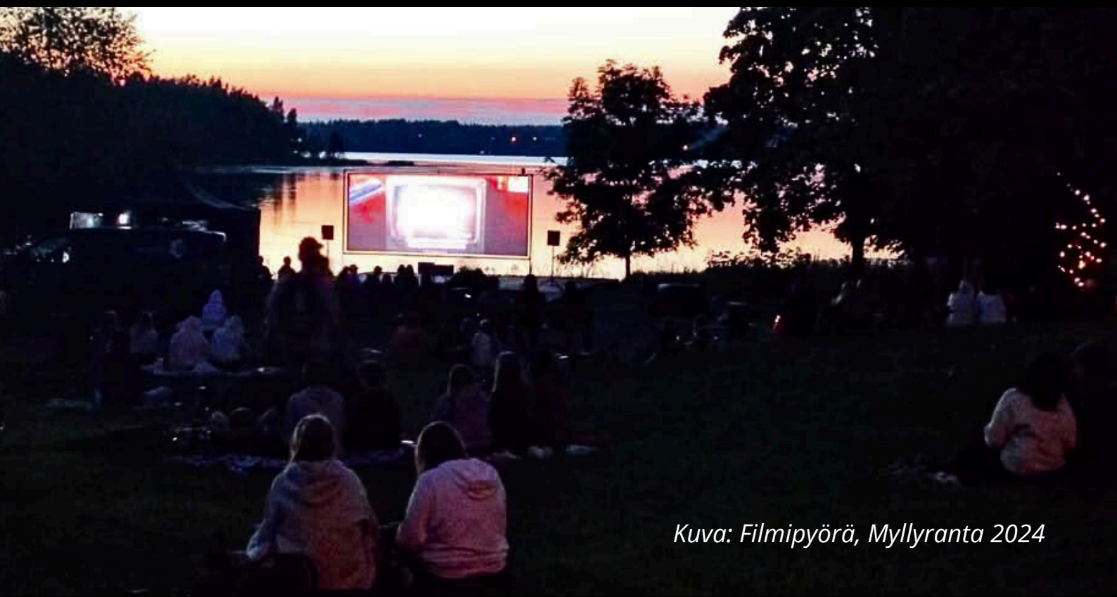
Kuva: Filmipyörä, Myllyranta 2024

Nuorisopalvelut järjestää nuorille monipuolisia tapahtumia, jotka edistävät nuorten yhteisöllisyyttä, luovuutta ja hyvinvointia. Tavoitteena on tarjota turvallisia sekä innostavia kohtaamisympäristöjä, jossa nuoret voivat tavata toisiaan ja kokea uusia asioita. Nuorten tapahtumissa on mukana myös nuorisotoiminnan ohjaajia, jotka tekevät nuorten kohtaamistyötä tapahtumien aikana. Nuorten ajankohtaiset tapahtumat löytyvät Lempäälän tapahtumakalenterista. Tapahtumakalenterista löytyy Nuoret -kategoria, jonka alta nuorille suunnatut tapahtumat ovat helposti löydettävissä. Mainostamme nuorisopalvelujen tapahtumia myös sosiaalisen median kanavissamme. Tapahtumakalenteri löytyy osoitteesta: tapahtumat.lempaala.fi