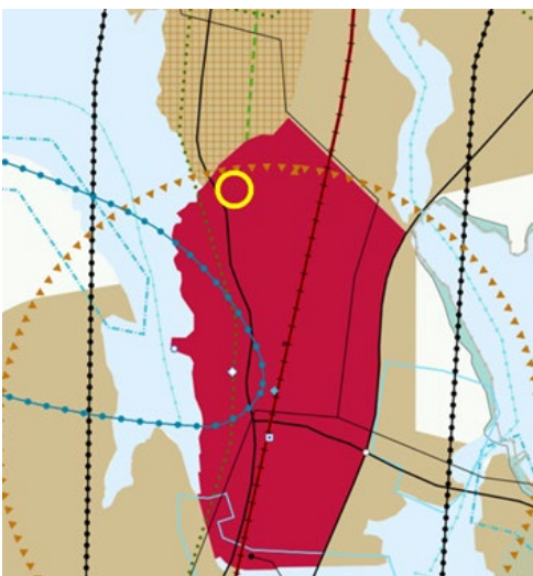
Ote maakuntakaavasta. Suunnittelualueen likimääräinen sijainti keltaisella ympyrällä.

Alue kuuluu myös kaupunkiseudun keskusakselin kehittämisvyöhykkeeseen, ulottuen Tampereen kaupunkikeskustasta Lempäälän keskusta. Suunnittelualue sijoittuu myös tiivistettävälle asemaseudulle, mikä tarkoittaa aluetta, jolla suunnitellaan yhdyskuntarakenteen tiivistämistä raideliikenteen tukemiseksi.